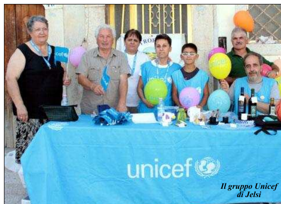
Il gruppo Unicef di Jelsi

Viva e funzionante la sede dell'associazione che è presente ed operativa sul territorio da oltre 12 anni, garantendo il massimo della disponibilità e della collaborazione per le grandi cause.